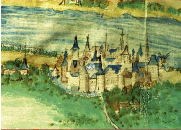
De maartens en poorten van Schoonhoven rond 1520: detail ijn. schilderij/kaart van (waarschijnlijk) Pieter Dirckz. Crabeth.

Voor het bestuur van de stad is geld van levensbelang. Zonder geld kunnen er geen stedelijke voorzieningen worden ingesteld noch onderhouden. De verdediging van de stad tegen het water bijvoorbeeld, of tegen een oorlogszuchtige vijand. Maar ook het uitdiepen van de havens, het onderhoud van de straten en de bewaking van de kwaliteit van brood, vlees en vis waren afhankelijk van de inkomsten en de verdeling van uitgaven door het stadsbestuur.